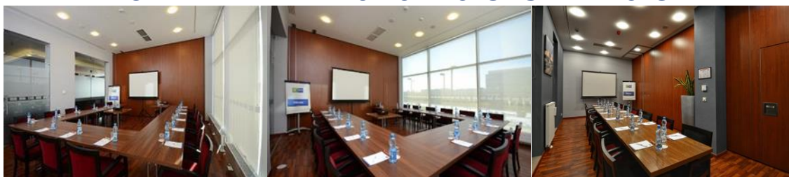
LOKALIZACJA SALI SZKOLENIOWYCH: PARTER

Nasz hotel dysponuje salą szkoleniową o wymiarach 3,50 m x 8,32 m, która pomieści do 18 osób oraz dwiema salami o powierzchni 32m 2 (do 15 osób w każdej salce)